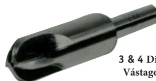
3 & 4 Dientes, Vástago de 1/2"