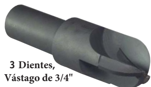
3 Dientes, Vástago de 3/4"