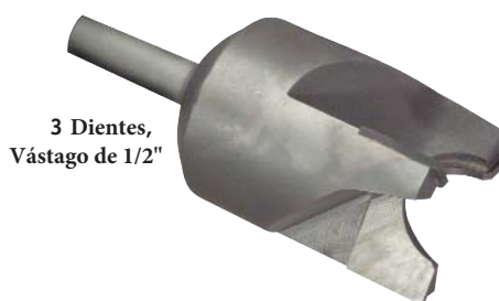
3 Dientes, Vástago de 1/2"