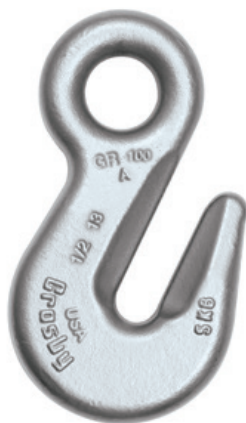
A-1328 Gancho de Ojo de Traba