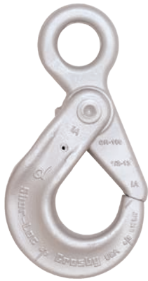
S-1316 Gancho de Ojo