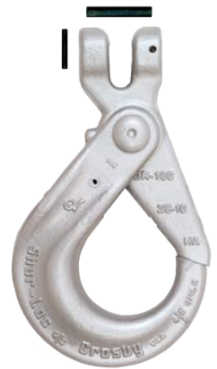
S-1317 Gancho Quijada